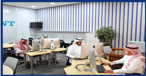
مراجعة المحتوى بعد التحويل