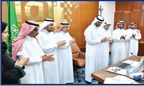
سعادة مدير الجامعة يبدشن برنامج العربية على الإنترنت على منصة بلاك بورد