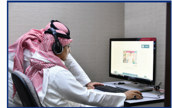
تجربة الفصول الافتراضية