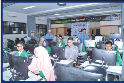
طلبة البرنامج في إحدى الجامعات الإندونيسية

❖ قامت الجامعة السعودية الإلكترونية بتوقيع عقود خدمات ناجزة؛ للإفادة من برنامج العربية على الإنترنت مع أكثر من ٥٤ جامعة حول العالم، كما تسعى في الجامعة السعودية الإلكترونية إلى توقيع المزيد من عقود الخدمات مع الجامعات، والمؤسسات التعليمية حول العالم.