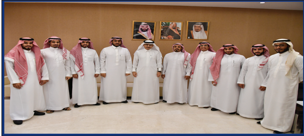
فريق عمل قسم اللغة العربية لغير الناطقين بها