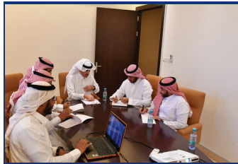
أحد اجتماعات فريق العمل لمناقشة مسيرة تحويل البرنامج على منصة بلاك بوردة

❖ جاء محتوى البرنامج وفقاً لمعايير المحتوى العولمي في التعليم التي دعت إليها منظمة اليونسكو العالمية، وهي: